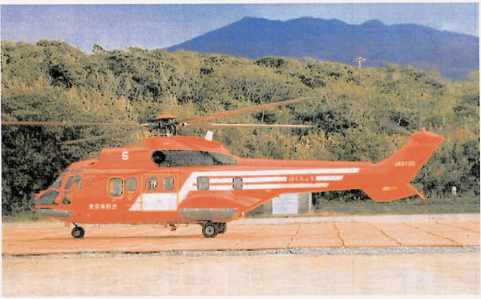
仮設ヘリポート (三宅中学校校庭)