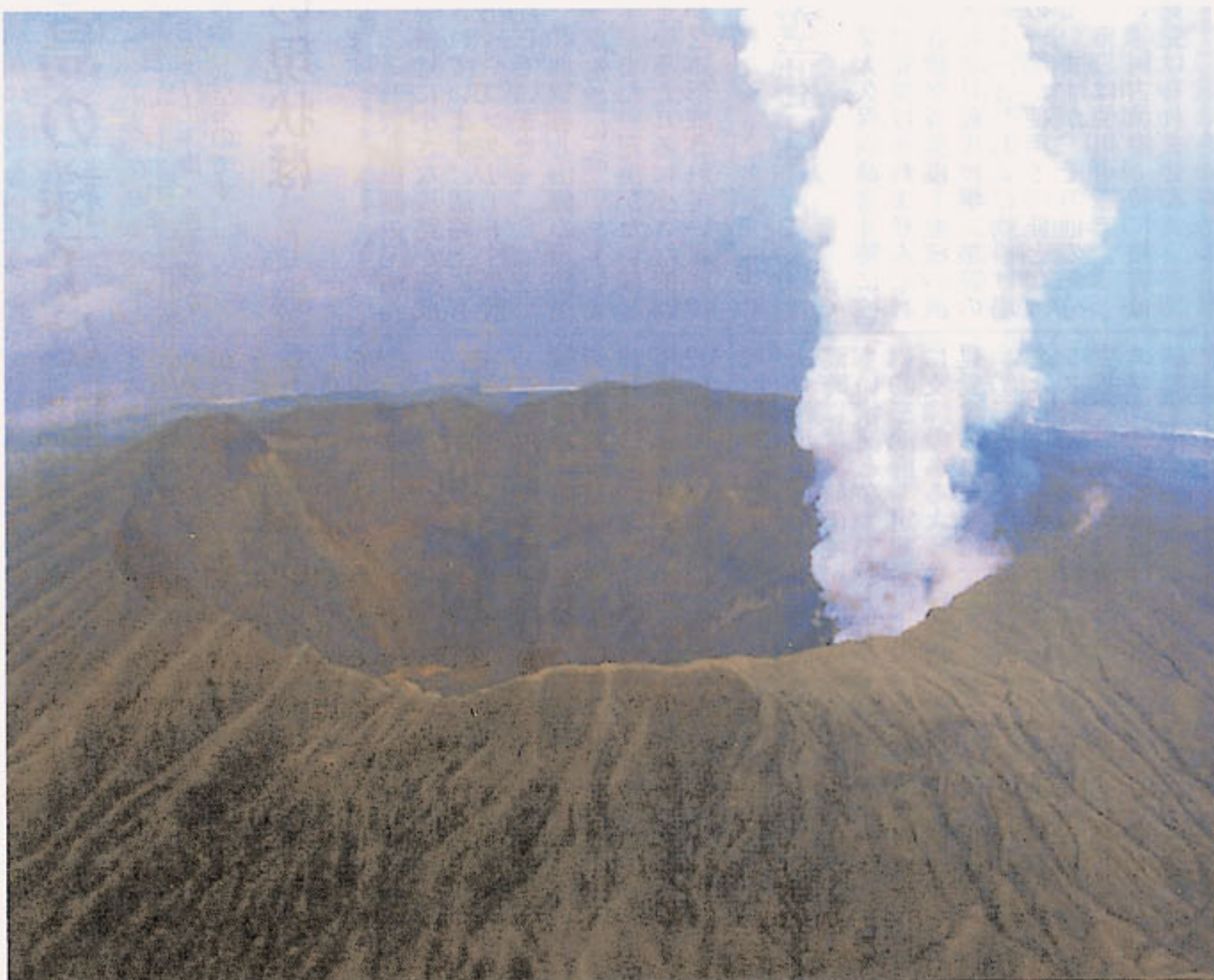
雄山山頂から噴煙を上げる三宅島 (11月12日陸上自衛隊ヘリから気象庁撮影)

今月の人口 人口 3,819人 世帯 1,958世帯 (12月1日現在) 編集 三宅村総務課 ☎03-5320-7824