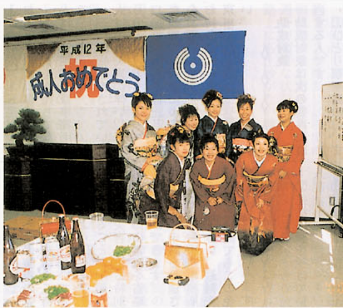
昨年の成人式祝賀会の様子

10月20日、東京都義援金 募集配分委員会が開催さ れ、三宅村、新島・神津島 近海地震等 に係る義援 金が3村へ 配分されま した。