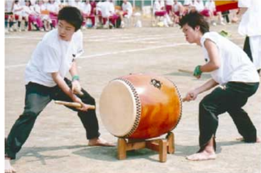
神籠太鼓で盛り上がる応援合戦

リレー」「棒取り」「やり投げ」「十人十一脚」「みんなでジャンプ」など。 三宅の生徒は短距離走・中距離走で男女とも圧倒的な強さを発揮しました。普