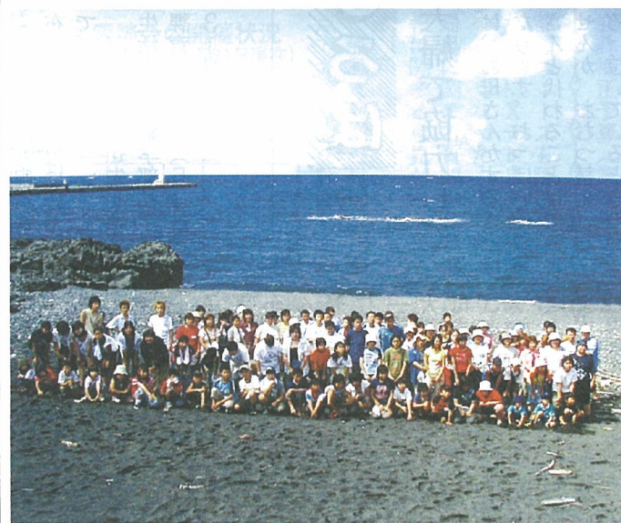
鏑ヶ浜で行われた「ふるさとふれあい体験」

このような転出児童交流行事には、三宅の子として心持ちを持ち続け互いの心をつなぐを保つという意義があります。この行事の企画・運営は三宅村立小学校の大切な仕事の一つです。そして、今年度も学校として帰島のための計画立案、教育計画整備を進めてきました。中でも、火山ガスト共生をしていくための学習をし、正しい知識を子どもたちに伝えるようにリスコミュニケーションーターとして研修を始めたこと