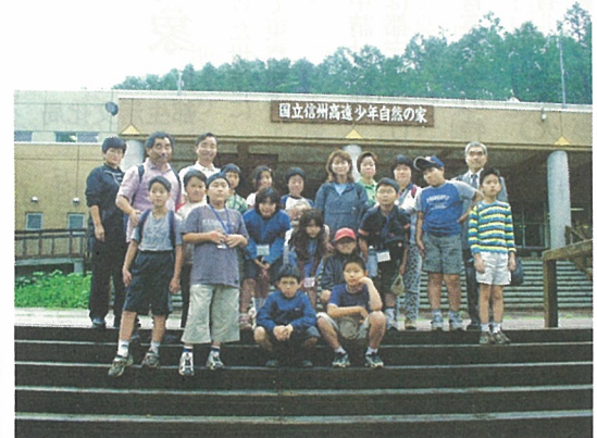
「高速体験学習」に参加した子供たち

希望をもって再開準備 今回の帰島の目玉は、浜辺での散策でした。参加した91人の子どもたちは、おおいに三宅の海との再会を楽しんでいました。「わあ、なつかしい」という子どもたちの歓声からも避難して満3年という長い時の流れを感じました。