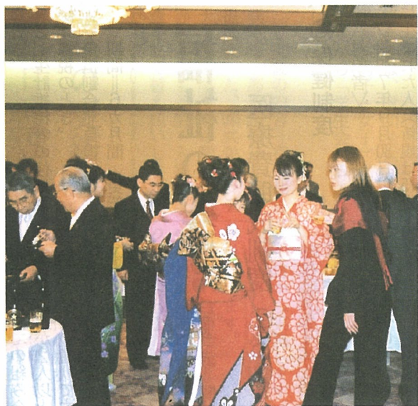
昨年の成人式祝賀会

平成16年の成人式は平成16年1月12日(月)成人の日、午前11時より、東京都立川市の「ザ・クレ」で開催します。受け付けは午前10時30分からとなります。 今回の対象者は昭和58年4月2日から昭和59年4月1日生まれで、45人が該当しています。 対象者の人には案内状を送付しておりますので、返信用のハガキで出席・欠席の回答を必ずご返送ください。 ▽問い合わせ先「三宅村教育委員会教育課社会教育係」042(550)9149。