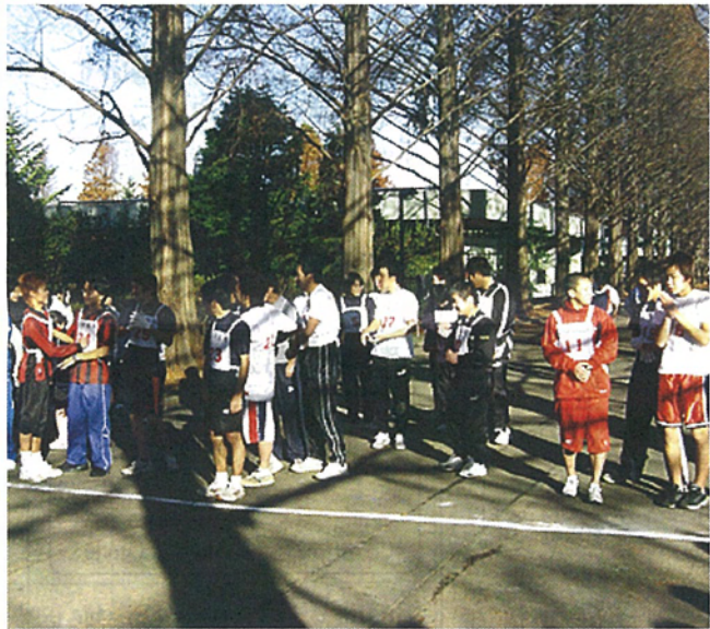
マラソン大会のスタートを待つ生徒たち

の大声援を受けて走る村挙げての一大行事でした。来年こそは島内一周マラソンが実現できることを念じています。