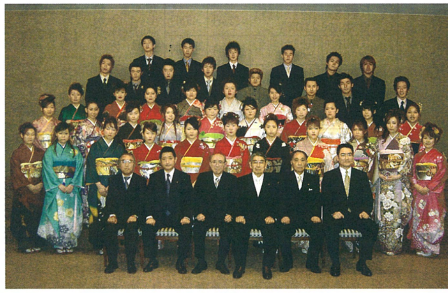
大人の仲間入りをした新成人の皆さん