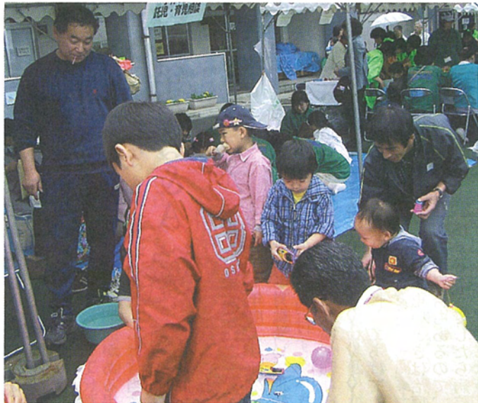
ふれあい集会の村立小学校ブース

島に向けてもっともっとさまざまな準備をし、避難解除に向けて動いていくものと思えます。小学校も、三宅島民が島に戻ったとき、子どもたちがすぐに登校できるようにするためにさまざまな準備をしていきます。安全に登校できるようにするための火山ガス対策、学校生活の中の安全、登下校など子どもの安全対策はもとより、学習面でも各学年が充実した内容でさらに学習できるように、ハ