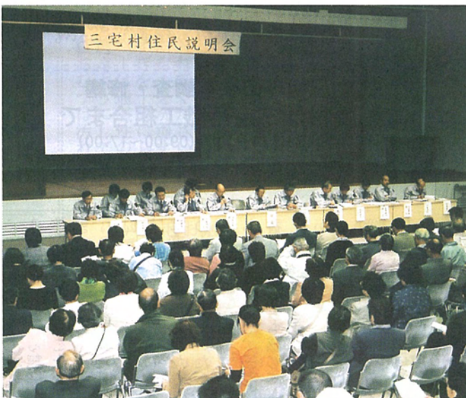
都庁大会議室で行われた説明会 (4月25日)

支援するために、昨年11月に開設され、高齢者の外出支援や、家事支援、インターネットを利用した各種情報が行っています。 帰島に関する意向調査について すでに各世帯に送付しております「帰島に関する意向調査」は、5月末日までに投函していただくようお願いしております。 この調査は、帰島の判断を行う上で大変重要な要素となるものです。「三宅島火山ガスに関する検討会報告」と「三宅島帰島プログラム準備検討会報告」をよくお読みいただき、すべて記入の上、必ず返送してください。