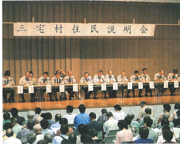
都庁で行われた住民説明会