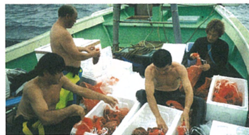
放流稚貝の区分け作業(三池沖にて)

業再開を図るため村、東京都が支援し、実施しています。今年も島内の9カ所に放流を行いました。放流場所、放流数など詳細については、本広報同封の「折り込み」をご覧ください。