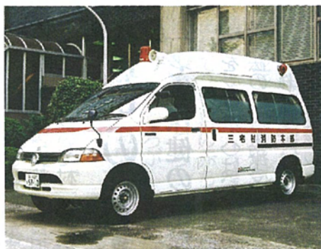
三宅村へ寄贈された車両

式会社から救急自動車の寄贈がありました。同社からの寄贈は記憶に新しく、昨年度と同様に噴火災害による被害を考慮に入れての異例の4台目となり、9月9日「キユウのキュウの