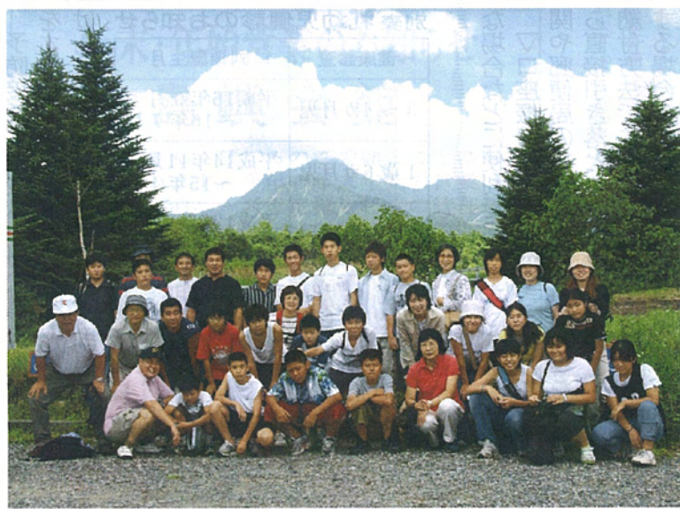
八ヶ岳をバックに記念撮影

最終日はまず、自分でちで作ったバターを食べた後、牛乳等に関してレシジャーからおもしろい話をたくさん聞き、その後は牧場での搾乳体験です。ジャージー牛にバケツをけとばされないうちにしながら、全員が牛乳を搾り終え、この日によく姿を現した八ヶ岳に別れを告げて、清里高原を後にしました。今年も楽しい思い出を通して、仲間とのきずなを確かめることができ、そして現在、学んでいる学校で2学期以降も頑張ってくれれば実感できる生徒たちでした。