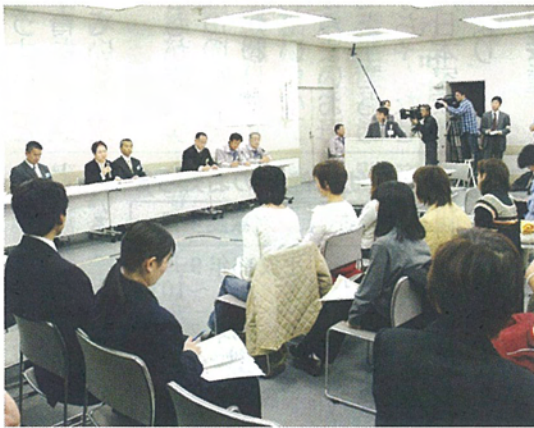
都庁で行われた保護者説明会

ない様子でした。15分の休憩後、小中学校の教員が各地域ごとに別れ、地域懇談会を行いました。ここでは部活動のこと、ガスマスクのこと、土曜日、日曜日の子どもの遊び場のことなど、具体的な質問が多く出され、保護者の皆さんの心配事や疑問に皆さんの心配事や疑問に思わされていたことなど活発な意見交換が行われまし その後、個人面談をす。ご心配なことがありましたら、いつでも結構です。中学校 ☎042(550)9268 〃の方にお問い合わせください。帰島後、安心して学校生活を送れることが一番大切です。保護者の皆さんのご協力をいただきながらよりよい方向を探っていきたくと思っておりますので、よろしくお願いいたします。