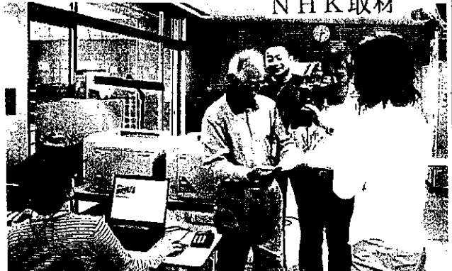
NHK・首都圏ネットワークによる立川支所の取材風景 デジカメ講座の様子が5月30日放映された