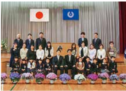
小学校の新1年生と保護者ら