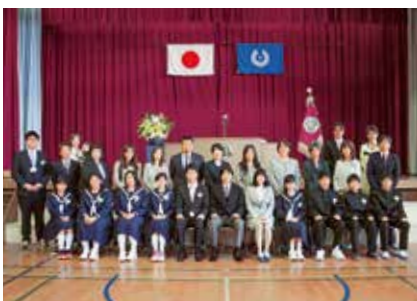
中学校の新1年生と保護者ら

4月9日、三宅村立三宅小学校、三宅村立三宅中学校、東京都立三宅高等学校にてそれぞれ入学式が挙行されました。