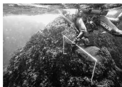
オオブサ漁場の様子

今回は比較的穏やかな海に恵まれ、これまでの調査で調査頻度の高い、伊ヶ谷地区のムカイグラ、神着地区のミツイシ、マツガシタの3地点で枠取り調査を行うことができました。3地点の1平方メートルの着生量は平均で1164gと過去10年間の調査の中で最も多い結果Ⅱ図1Ⅱとなりました。