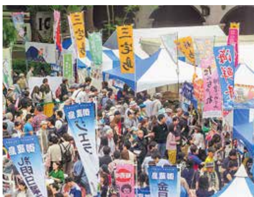
島じまんの三宅島ブース

14回目となる「愛らんどフェア島じまん2018」が5月26日、27日に竹芝橋で開催され、2日間で延べ10万9700人の人が来場しました。三宅島の物販ブースでは焼酎や明日葉製品、くさやなどが販売されました。飲食ブースでは商工会の明日葉の天ぷらや明日葉炊き込みご飯、うまか棒に長い行列ができ、三宅島のブースは大盛況でした。2階の展望エリアではポルタリング体験とVR体験が行われ、訪れた人々に好評でした。ステージではさかなクンの授業のほか、各島のステージ披露があり、三宅島からは一日目に阿古青年団の獅子舞、2日目に伊豆青年団の天神太鼓が披露され、今年も多彩な内容に会場は大いに盛り上がりしました。