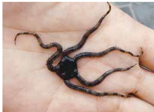
タコのような、ヒトデのような「クモヒトデ」

間などたくさん生きものがいます。静かにじっくりと水面をのぞいてみましょう。じっとしていると安心して岩や石の陰から出て、食事したり泳ぎ回ったり普段の生活ぶりを見せてくれます。時にはなんだかへんテコな生き物にも出会うことも。 そうそう磯は滑りやすいので歩くときは慎重に。また陽射しも強いので帽子や飲み物もお忘れなく。