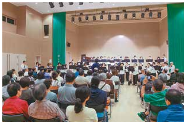
演奏するオカリナ合奏団

応募方法は講座名、住所、氏名、年代、性別、電話番号を明記し、はがき、FAXまたは電話でお申し込みください。 申し込みおよび問い合わせは本校ホームページをご覧ください。