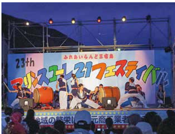
神着郷土芸能保存会「木遣り太鼓」(昨年)

三宅島商工会では、第24回ふれあいランド三宅島マリンスコアレ21フェスティバルを開催します。