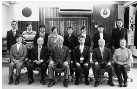
式典終了後の集合写真