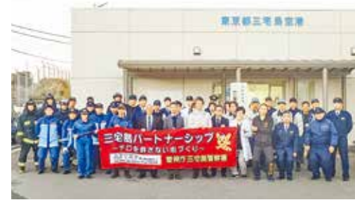
総合訓練後の集合写真

11月15日、三宅島空港にて令和元年度三宅島空港総合訓練が行われました。訓練では不法侵入対応訓練、テロ・ハイジャック対応訓練および消防救難訓練が行われ、三宅島空港管理事務所をはじめ三宅島警察署、三宅村消防本部、新中央航空(株)、東邦航空(株)、今