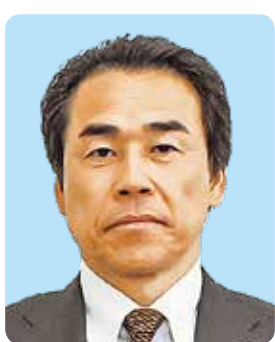
三宅村議会議長 谷 寿文

村民憲章において文化が息づく村を標榜する本村の歴史や伝統を村民の誇りとし、先人の歩みや地域に根づく文化を村民の皆さまとともに令和の新しい時代に受け継いでまいりたいと考えております。