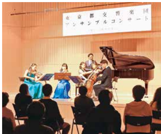
弦楽四重奏とピアノ

△コロナ禍の状況の中で、三宅村として開催していただきありがとうございます。三宅村として開催していただきありがとうございます。三宅村として開催していただきありがとうございます。