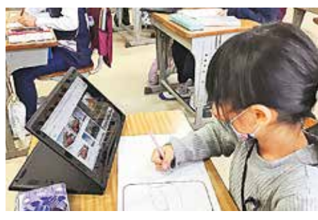
新型タブレット端末を使う様子

三宅村では、7年前より小中学生全員が、一人一台のタブレット端末を活用しています。昨年の長期にわたる臨時休校中には、課題やりとり型のオンライン学習で有効に使われました。そして、昨年12月には、新機種が導入されました。今回は、キーボード付きのタブレット端末で、学習への