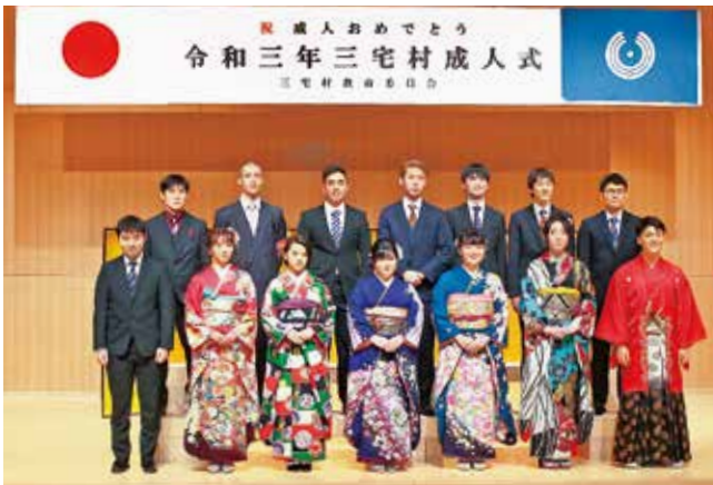
記念写真に納まる新成人の皆さま

は、笑顔と感謝、決意を語り、未来への決意を述べた。三宅村文化会館にて挙行された。今年度は新型コロナウイルス感染症のさまざまな感染対策のもと、規模を縮小しての挙行となりました。14人(男性9人、女性5人)の新成人の皆さんは、笑顔と感謝、決意を語り、未来への決意を述べた。