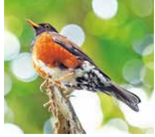
以前は3万羽は生息していたと考えられています

三宅島自然だより「アカコッコの生息数回復にご協力を!」 三宅島には何羽くらいアカコッコがいるのでしょうか。秋冬にあまり見ませんね。そこで、アカコッコ館周辺のアカコッコに機械を付けて秋冬の行動を調べたところ、秋冬の間は雄山の上(立入禁止区域)で過ごしていた個体や神津島に行っていた個体がありました。春夏に比べ見る頻度が減るわけですね。 また島民の皆さまとも協力して、三宅島に生息しているアカコッコの個体数を調べています。2016年には推定7800羽ほどだったアカコッコですが2020年の調査では推定5800羽ほどと大幅に減少しています。 天敵の増加や生活環境の悪化など考えられる要因はさまざまです。皆さまの周りでは近年ツル植物が目立ってきていませんか。ツル植物が繁茂するとエサとなるミミズなどが探しくなくなり、一方ツル植物を除去するとアカコッコが増えることも調査で分かっています。 ツル植物の除去以外にも自宅やその周辺で行うことのできる生息環境の改善方法をまとめたリーフレットをアカコッコ館では無料にて配布しています。アカコッコの生息数回復にご協力ください。