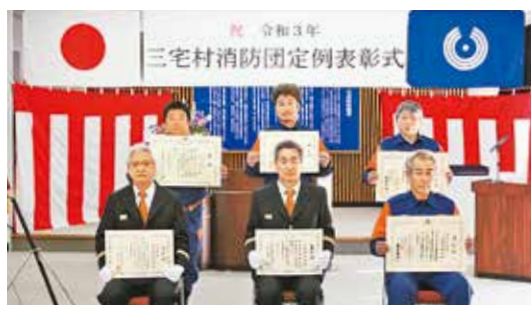
令和3年消防団定例被表彰者の皆さん