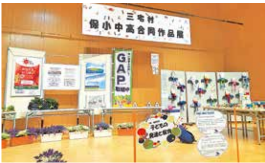
出展された作品の数々

1月14日(水)から1月20日(水)まで三宅村文化会館において保小中高合同作品展が開催されました。