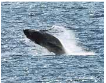
ザトウクジラがブリーチングする様子

冬から春にかけて、三宅島沖合いでも多数目撃されるようになったザトウクジラ。三宅島観光協会では