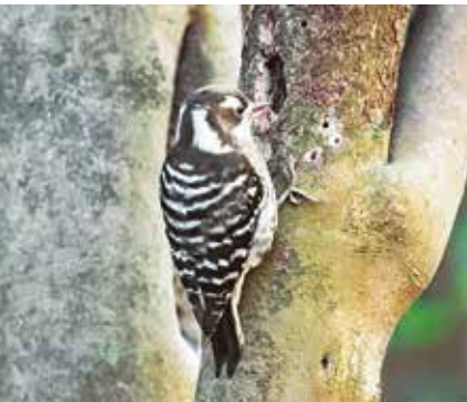
大きさはスズメほど。日本で一番小さなキツツキです