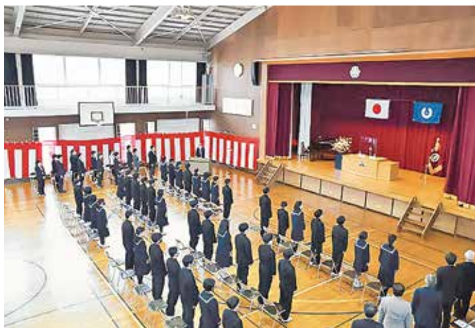
三宅中学校の入学式

時間の短縮で行いました。在校生や教職員、保護者などが拍手で迎える中、入学児童生徒は、少し緊張の面持ちで入場しました。入学の呼名での元気のよい返事から、入学の喜びと新たな決意を感じる式となりました。