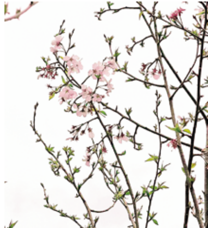
天下第一の桜、開花

船の乗降の際の利便性と安全性などを考慮した、日除け・雨除けの仮設施設が三池港に設置されました。長さは約24メートルで、全ての方々が利用しやすいようパリアフリーとなっております。 今後も三池港船客待合所の新築工事に併せ、整備を進めていく予定です。