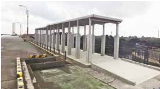
完成した日除け・雨除け施設

令和元年に契約した防災行政無線デジタル化整備工事は、約3年の歳月をかけた竣工し、4月8日(金)に請負業者の三峰無線(株)と共に竣工式が行われました。本村は、幾度の噴火を繰り返すと共に、近年では地球温暖化などの影響による豪雨のほか、発生が懸念される南海トラフ地震など、さまざまな自然災害の発生に備えなければなりません。 今後は本設備を最大限に活用し、災害情報を迅速かつ広範囲に伝達し、被害の軽減と地域防災力の向上を図り、災害に強い安心・安全な島づくりを目指します。