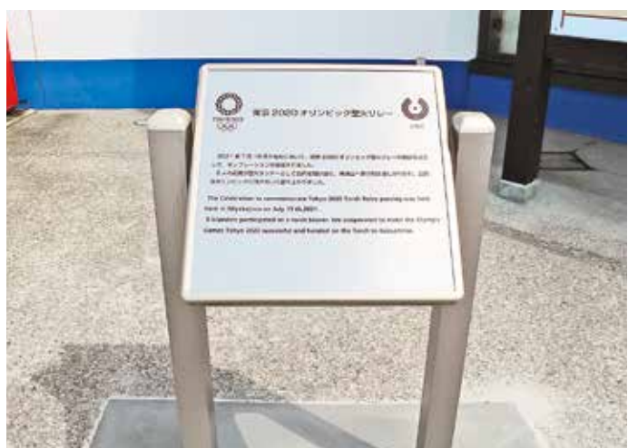
設置されたオリンピック聖火リレー銘板

今年度は、小学校21人、中学校15人、計36人の新入生が人生の新しい一歩を踏み出しました。そして今年度の在籍者数は、小学校99人(昨年度より10人増)、中学校40人(同6人増)となります。