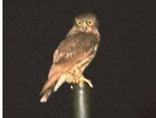
ハトほどの大きさの小さなフクロウ

「アオバスタ」というフクロウの仲間です。日本には木々の青葉が鮮やかになる4月下旬～5月上旬頃に渡ってくるため、この名前があります。実は三宅島では1年を通して暮らしていません。そのため冬でも暖かい夜などにこの声を聞くことができます。 夜、光に集まる昆虫を主なエサとしています。最近、島で