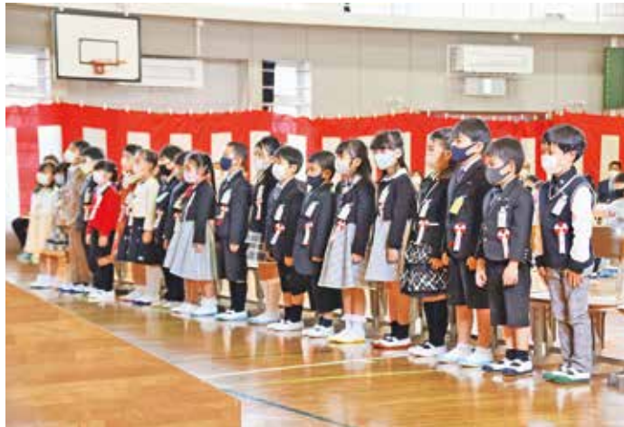
三宅小学校の新入生

4月7日(木)、三宅小学校と三宅中学校において入学式が挙行されました。今年度は昨年と同様に、新型コロナウイルス対策のため、マスクの着用、規模の縮小、