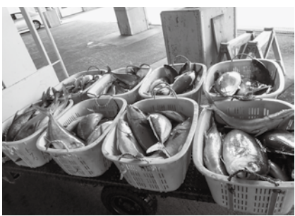
水揚げされたカンパチ

水揚げされた魚は、島内の一部の商店で販売されています。ぜひ、定置網で捕れた三宅島の新鮮な魚を味わってください。 問い合わせは観光産業課農林水産係 ☎0992。