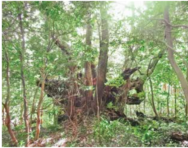
御焼(みやけ)の黄泉(よみ)の椎

三宅村には、巨樹・巨木がスタジイを中心に3000本以上あると言われています。その中でも「御焼の黄泉の椎」は樹齢約1000年と言われ、全国最大級の幹回りとなっています。「補陀落の椎」は樹齢約600年と言われ、株立ちスタジイの総幹周で全国3位の