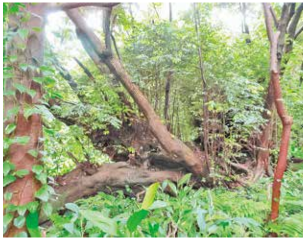
補陀落(ふだらく)の椎

の大きさです。この2本の椎の木は今年8月に三宅村指定天然記念物に指定されました。