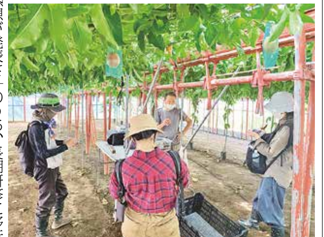
栽培について説明を聞く参加者

2日目以降は、農家や東京都島しょ農林水産総合センター三宅事業所の指導を受け、キョウウランの出荷調整作業やカンキツの圃場管理、パッションフルーツの収穫などを体験し、農業関係者と交流を深めました。