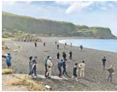
今年度実施の様子

グリーン 大久保浜海水浴場で 2000人が海岸2キロを清掃 9月18日(日)「水がきれいな海水浴場ランキング2022」にて全国4位となった三宅村大久保浜海水浴場でビーチクリーン(主催・三宅島観光協会、三宅村商工会)が開催されました。当日は、台風14号の接近に伴い開催が危ぶまれましたが、参加者からは「奇麗になるのは気持ちが良い」「三宅島の他の海岸でも実施してほしい」などの声が聞かれ、今後の三宅村における「SDGs」への取り組み(海の豊かさを守ろう)と