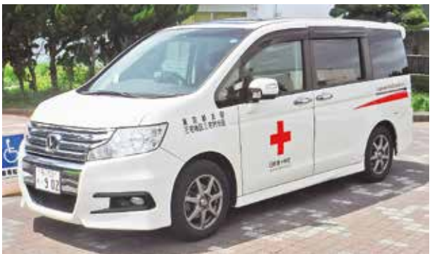
配備された災害救援用車両

日本赤十字社東京都支部から災害救援用車両が配備されました。日本赤十字の活動を推進しながら、災害時などの対応のために活用します。