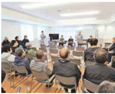
避難訓練の講評を聞く参加者

南海トラフ地震 大津波を想定 11月27日(日)、大久保地区の居住者を対象に「地震だ、津波だ、すぐ避難！少しでも早く、少しでも高く」をスローガンに係関係機関協力のもと津波避難訓練を実施しました。 訓練は、南海トラフ巨大地震が発生し、三宅島で震度5弱の揺れがあり、その