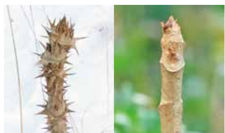
北海道のタラノキ(左)と三宅島のタラノキ(右)

三宅島は本州などと陸続きになったことがなく、入ってくることのできる生き物は限られています。本来生息している哺乳類はアカネズミと2種類のコウモリだけです。 ウサギなどの草食動物がいないため島の植物はある変わった進化をしました。例えば天ぷらで美味しいタラの芽。三宅島のタラノキと違う地域のタラノキを見比べてみると、他の地域のタラノキは草食動物から食べられないようにびっし