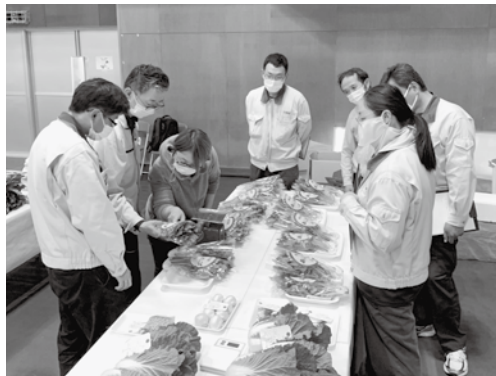
農産物品評会の審査風景

キキョウランは、いずれの出品物も先端の調整が丁寧に行われ、葉は光沢があり、外観に優れていました。その中でも10本のそろいや草姿のバランスがよく、葉のポリウムがあり、病害虫被害の少ない品を三宅村長賞としました。