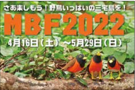
春は野鳥が主役!アカコッコ館のイベントで満喫しよう

ほかにアカコッコ館では、季節によって海の自然を楽しむイベントなども開催します。自然の豊かな三宅島、その自然の魅力を知って楽しんでみませんか。