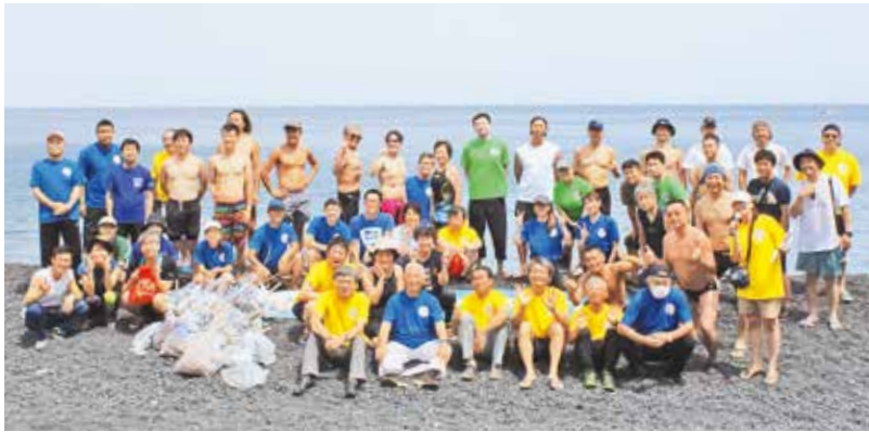
集合写真に納まる選手ら

『挑むは黒潮』を合言葉に、7月8日「三宅島OWS大会2023」が大久保に、7月8日「三宅島OWS」とは、オープンウ