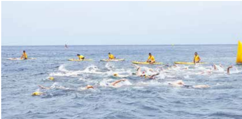
黒潮に挑む選手たち

オータースイミングの略で、海・川・湖などの自然環境下で開催する水泳競技であり、夏季オリンピックでは「マラソンスイミング」という競技名称で行われます。