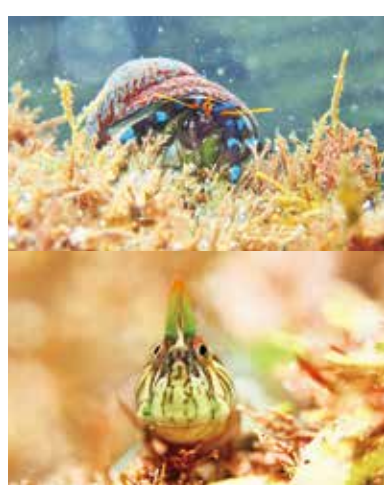
ユビワサンゴヤドカリとタネギンボ

なユビワサンゴヤドカリやタネギンボなどは長太郎池のような大きな潮だまりではほとんど見られず、小さな潮だまりならではの生き物です。 ですが、小さな潮だまりにも危険な事があります。鋭いトゲを持つガンガゼやウツボ、割れたビンなどもあるかもしれません。 また、濡れた岩場での転倒や磯遊びに夢中になって、熱中症になってしまったり、適度に休憩や水分をとって楽しく過ごしましょう。