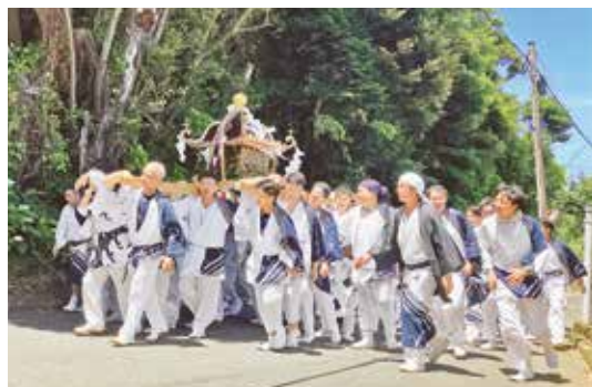
神着地区を巡るみこし

7月15日、16日の2日、五穀豊穡・大漁・家内安全・無病息災を祈願する「牛頭(ごず)天王祭」が行われました。翌16日は午前11時45分ごろからみこしが宮出しされました。神着地区内をみこし、太鼓、木遣りが三位一体となって巡りながら要所でみこしを力強くもむ(みこしを大きく上げ下げする)担ぎ手の姿は、とても迫力があり圧巻でした。巡行を終えたみこしは無事に御笏神社へ納められました。