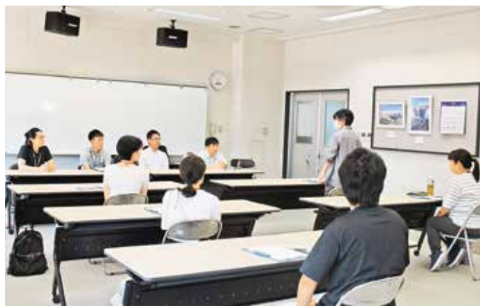
1階大会議室で行われたオリエンテーション

を交えたオリエンテーションを行った後に役場内の各課の様子や仕事内容の説明を受け、その後、職員住宅を見学しました。 午後からは希望する職種に分かれ、保育園・中央診療所で職員により実務について説明を受けました。