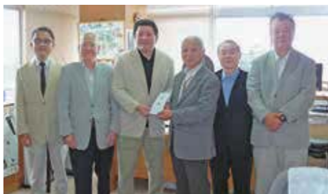
櫻田村長に義援金を渡す各自治会長 (伊豆自治会は副会長)