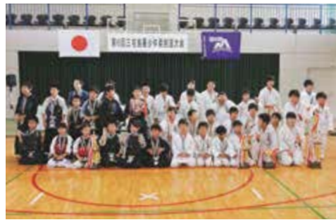
試合後、写真に納まる選手たち