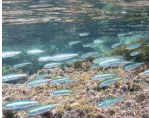
長太郎池を泳ぐ海水魚

でも、行く時間も間違えると楽しめません。満潮時には、波が多く押し寄せ、中に入るのは大変危険です。一方、干潮時であれば、周りの海が少々荒れていても、長太郎池の中は穏やかで安全