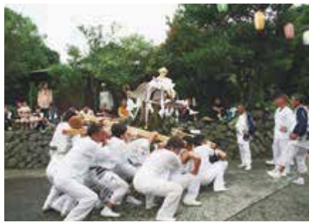
御輿をもむ担ぎ手たち

7月17日、五穀豊穡・大漁・家内安全・無病息災を祈願する「牛頭(ごず)天王祭」が神着地区で行われました。