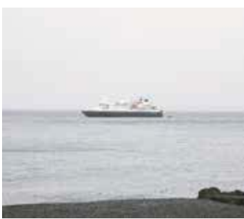
シルバー・ディスカバラー号

三宅支庁、村役場、観光協会をはじめ島民が迎える中、59人の外国人観光客がボートを使って上陸し、新鼻山や椎取神社、火山体験遊歩道などの島内観光と、バードウォッチングの2つのグループに別れ、バス3台で島内を巡りました。客船の乗員・乗客には自然科学や歴史・文化専門