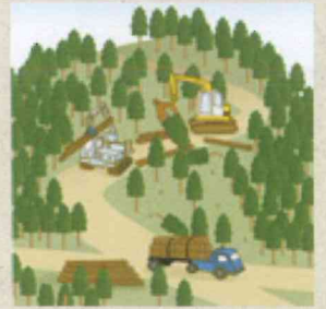
適切に森林整備を推進!