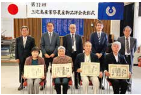
農産物品評会の受賞者ら

11月20日(土)、第22回三宅島産業祭は、新型コロナウイルス感染症の感染拡大防止のため、開催規模を縮小