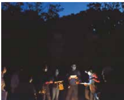
アカコッコがよくさえずる日の出前に調査を行う

三宅島自然だより 「三宅島のアカコッコの数は？」 コッコの数は？ 毎年行っている三宅島のアカコッコの個体数調査。昨年5月にも島民の方に協力いただき実施しました。調査は大路池などの深い森や伊豆岬などの草地、雄山林道などの林、都道沿いなど環境の異なる16カ所に調査コースを作り、さえずっていたアカコッコを数えます。アカコッコが多かったのは大路池などの深い森ではなく、雄山林道などの林の環境でした。