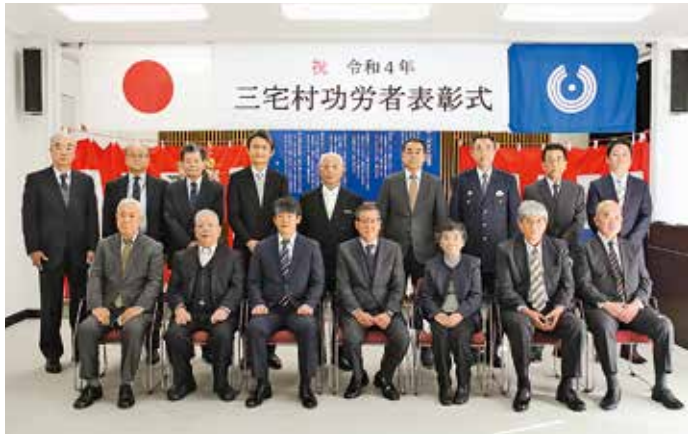
写真に納まる受賞者ら

令和4年三宅村功労者表彰式が「村民の日」の2月1日(火)午前10時から三宅村役場臨時庁舎において行われ、「各界の功労者」に表彰状と記念品が贈られました。