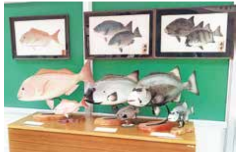
石原氏による寄贈作品