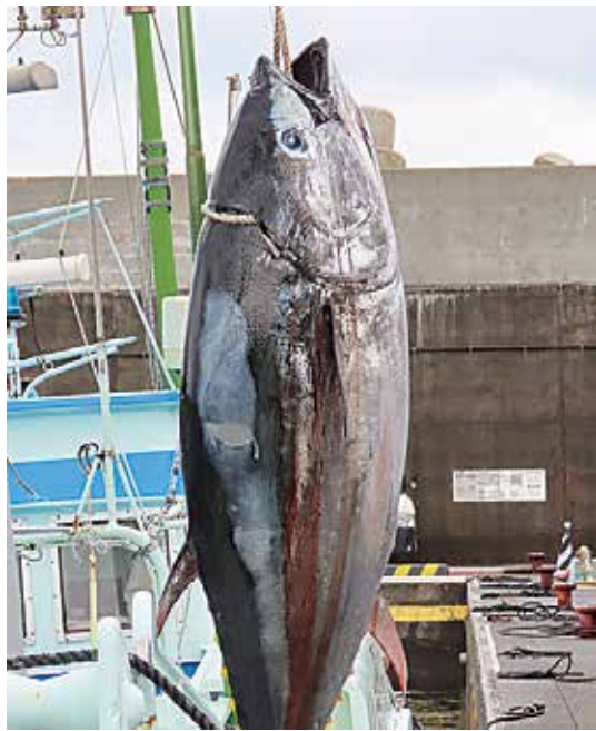
阿古漁港に水揚げされたマグロ

漁獲されました。ある漁師は「イワシの群れを追ってついでにきたクロマグロにちょうど当たった」と話しており、新人の漁師は「釣れて気持ち良かった」とうれしそうに語っていました。現在、三宅島漁業協同組合では、国や都によるクロマグロの漁獲可能量の設定範囲内で水揚げを行ってお