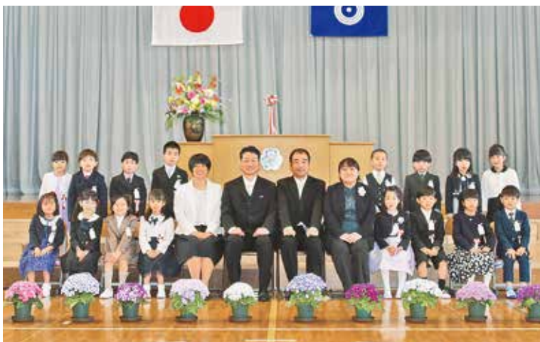
小学校の新1年生と教諭

4月9日(火)、三宅小学校と三宅中学校において入学式が挙行されました。在校生や教職員、保護者などが拍手で迎える中、入学児童生徒は、少し緊張の面持ちで入場しました。入学の呼び名の元気のよい返事から、入学の喜びと新たな決意を感じる式となりました。