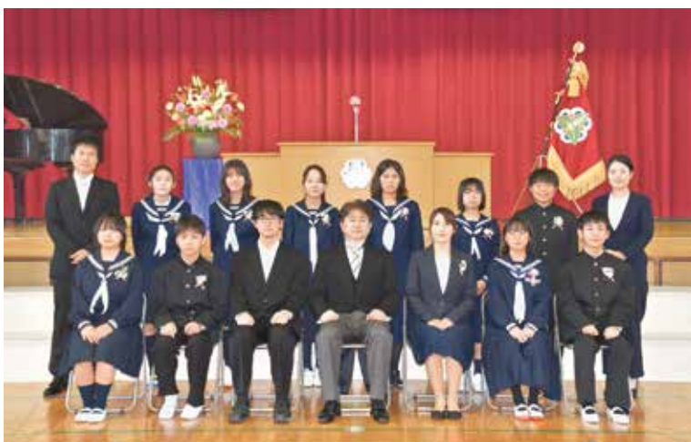
中学校の新1年生と教諭

今年度は、小学校16人、中学校10人、計26人の新入生が人生の新しい一歩を踏み出しました。そして今年度の在籍者数は、小学校96人(令和5年度より2人増加)、中学校38人(同4人減少)となります。