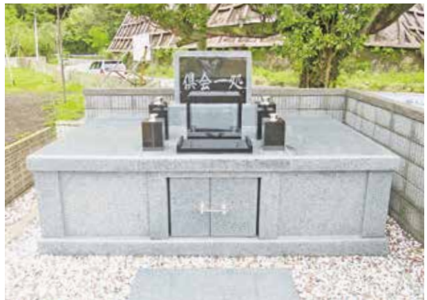
完成した三宅村合葬墓

少子高齢化や核家族化など、やむを得ない事情でお墓の継承、焼骨の管理ができない方への選択肢のひとつとして、宗教や血縁などにとらわれず複数の焼骨を埋葬するお墓のことです。