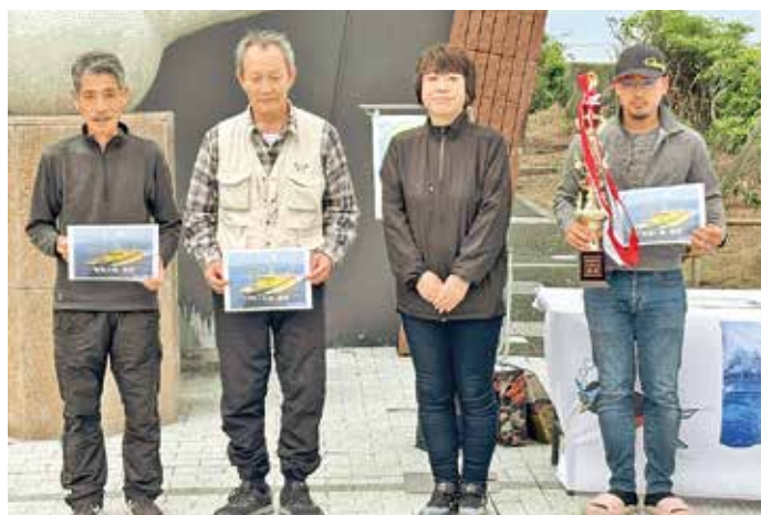
山高村長と各部門の優勝者

魚の部1位はイヌズミ重量1・58キ、全長47・1キでした。会場では上位3人が表彰され、その後の特産品や東海汽船無料乗船券などが当