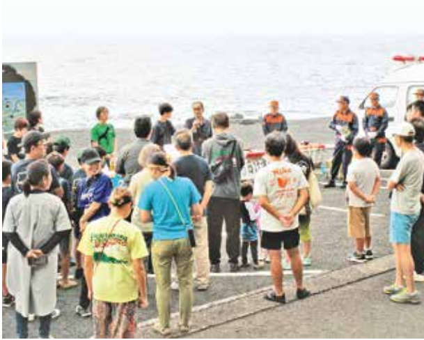
ビーチクリーンの説明を受ける参加者

「水がきれいな海水浴場ランキング2024」にて全国1位となった三宅村大久保浜海水浴場でビーチクリーン(主催・三宅島観光協会、三宅村商工会、七島信用組合)が10月6日(日)に開催されました。