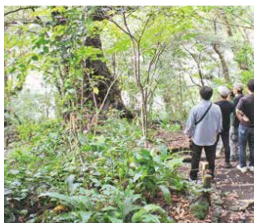
大路池の自然に足を止める参加者ら

チームが競い合いました。 最後に行われた「未就学児 ちびっこレース」では、子 どもたちが「うさぎさん のお菓子袋」目掛けて一斉に 走り、会場はあたたかい空 気に包まれました。 また、会場では来年行わ れる第20回世界陸上競技選 手権大会(東京開催は34年 ぶり)と第25 回夏季デフリ ンピック競技 大会(日本初 開催)に向け て、パネル展 示や選手への 応援メッセー ジ募集も行わ れ、100を 超えるメッセ ージが集まる など、運動会 同様盛り上が りました。 ご協力いた だきありがとう ございました。