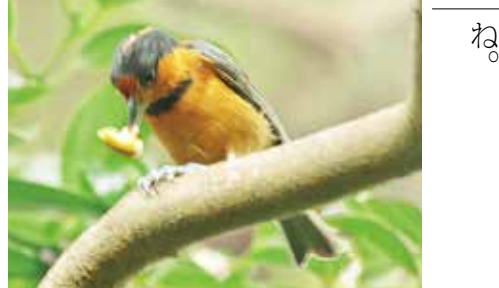
スタジイの実を食べる オーストンヤマガラ

しかし、20年以上スタジ イの病気が続き、現在ほと んど実がなりません。オ ーストンヤマガラは減り続け ていると思われ、実際に島 外のバードウォッチャーか らも以前に比べ、少なく なったという声を多く聞 くようになりました。 生息地が限られ、絶滅危 惧種となっているオースト ンヤマガラ。彼らがいつま でも三宅島で見られるよう 大切にしていきたいです ね。