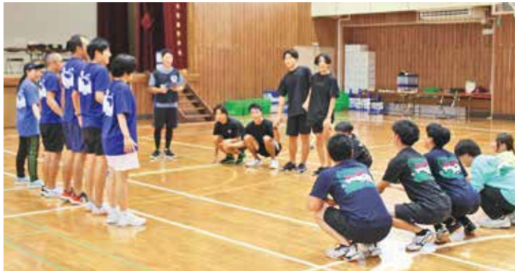
三つ巴でゲー・チョコ・パー

「おたのしみ運動会」開催 34チーム170人が参加 9月29日(日)、三宅村スポ ーツイベント第7回「おた のしみ運動会」が都立三宅 高等学校体育館にて開催さ れました。