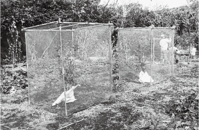
写真2 簡易防風ユニット設置状況