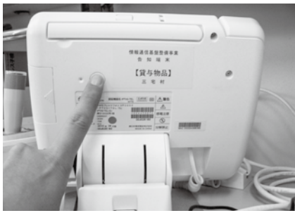
本体の裏側にある電源ボタン

IP告知端末の背面にある電源ボタン(1円玉サイズ)を「ピッ」という音がするまで押してください。 音が鳴った後、画面に「再起動」というボタンが表示されますので押してください。 再起動が終わり、通常画面に戻るのに5分ほどかかります。再起動中は画面に「再起動中です」や「FLEET, S PHONE」などと表示されます。再起動終了後、通常画面に戻り正