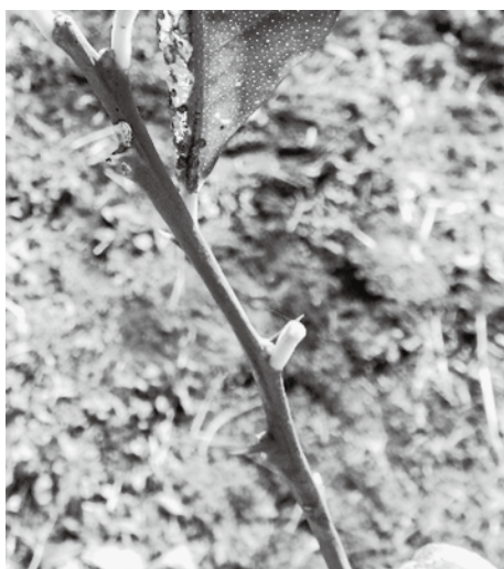
写真3 風により落葉したレモンの葉

三宅村では新たな換金作物の一つとして、レモンなどのカンキツ類の栽培を奨励しています。しかし、カンキツ類は風に弱く、落葉や病害が発生しやすいことから、年平均風速が毎秒6以上ある三宅村でカンキツ類を栽培する場合は、何かしらの防風対策が必須です。 そこで、当事業所が開発したカンキツ類のための簡易防風ユニットを現地の栽培圃場に設置し、防風効果について検証しました。 三宅村では新たな換金作物の一つとして、レモンなどのカンキツ類の栽培を奨励しています。しかし、カンキツ類は風に弱く、落葉や病害が発生しやすいことから、年平均風速が毎秒6以上ある三宅村でカンキツ類を栽培する場合は、何かしらの防風対策が必須です。 そこで、当事業所が開発したカンキツ類のための簡易防風ユニットを現地の栽培圃場に設置し、防風効果について検証しました。 簡易防風ユニットは、樹1本ずつを直管パイプと防風ネットで取り囲むよう設置した構造で、幅・奥行は1.5m、高さは1.8mです(写真1)。 令和5年12月5日、露地定植2年生のレモン樹に簡易防風ユニットを設置して試験区とし、比較用に簡易防風ユニットを設置しないレモン樹を用意して対照区としました(写真2)。 試験期間である12月5日から翌年1月31日までの、各区の風速と風による落葉を調査しました。 試験の結果、簡易防風ユニットを利用することでユニット内の風速が抑えられ、落葉率も下げることができました。このことから、レモンなどのカンキツ類の育苗期間においては、簡易防風ユニットを活用することで防風効果が期待できます。 簡易防風ユニット1基あたり必要資材および経費は、直径25mmの直管パイプ6本、4mm径目合防風ネット約6.5m 2 、経費は約3万4000円(令和5年当時)でした。 本検証に関する質問や相談は島しょ農林水産総合センター三宅事業所 ☎01414まで。 その結果、試験期間中に最も強い風を観測した12月17日の各区の最大風速は、試験区で毎秒4.5m/s、対照区で毎秒5.4m/sとなり、ユニット内の風速は毎秒約1.1m/s低下しました。また、各区の落葉率は試験区30.9%、対照区53.8%となり、試験区は対照区より22.9%抑えることができました。 試験の結果、簡易防風ユニットを利用することでユニット内の風速が抑えられ、落葉率も下げることができました。このことから、レモンなどのカンキツ類の育苗期間においては、簡易防風ユニットを活用することで防風効果が期待できます。