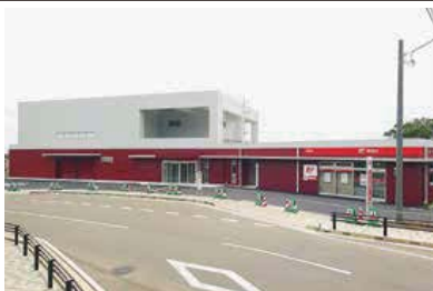
都道から見た三宅村文化会館

帰島10周年を記念した式典を、坪田地区にこのほど完成した三宅村文化会館の完成記念式典と併せて、7月25日(土)に開催します。 式典は11時開始ですが会場の都合により村民の皆さんへの開場は午後0時15分