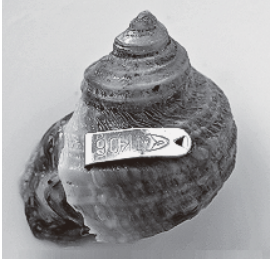
ステンレス標識を付けたサザエ

大島事業所では栽培漁業センターと協力し、サザエ稚貝の、より良い放流場所を探すための試験を行っています。放流する稚貝にはステンレス製の標識をあらかじめ付け、天然のものと同区別ができるようにしています。 【平成26年の調査結果】 昨年放流した場所は、丈が短い海藻がまはりに生える程度で栄養状態はあまり良くありませんでしたが、調べたところ稚貝の成長は良好で、サザエには住みやすい場所であることが分かりました。 【サザエの食性について】 水浴場の遊泳状況はIP告知端末や三宅島観光協会ホームページ(http://www.hyakujima.gr.jp/)で最新の情報をお知らせします。問い合わせは観光産業課 ☎09220。 このサザエの消化管を調べたところ、紅藻(こうそ)など複数種の海藻片や石灰藻、微細な貝類が確認でき、90%以上を紅藻が占めていました。 【DNA分析】 紅藻の欠片を詳しく調べ、ためにDNA分析を行うため、その構造が紅藻綱スギノリ目オキツノリ科と最も近く、海藻片は周辺に生えていたオキツノリ科の「ハリガネ」と考えられます。 これまでハリガネという海藻は固く、貝類の餌には適さないと思