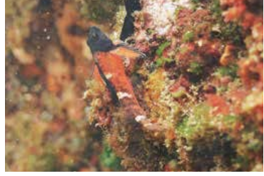
婚姻色となったミヤケヘビギンポ (全長5cmほど)

が...その名も「ミヤケヘビギンポ」。三宅島で発見された魚です。普段はとても地味な色をしています。繁殖期を迎えたオスはアカコッコによく似た婚姻色になります。繁殖期にあたる春には、長太郎池や土方海岸などの潮だまりの至る所でこのアカコッコカラーの魚が見られます。