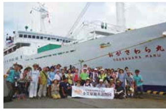
親善訪問団の一行(父島の二見港にて)

おがさわら丸初寄港 親善訪問団小笠原へ 5月31日、おがさわら丸が三宅島に初寄港し、三池港では大勢の島民が迎えられました。三宅島からは小笠原親善訪問団(企画・三宅島観光協会)の一行88人が乗り込み、神着郷土芸能保存会の木遣太鼓が響く中、おがさわら丸は出航していきました。