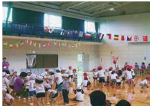
玉入れをする園児たち

5月から始まったボランティア団体による春の植林ですが、6月は「富士ゼロックス東京株式会社からは「倶楽部」「一般社団法人エコロジー・カフェ」「特定非営利活動法人園芸アグリセンター」の3団体が来島して植林を行いました。それぞれの団体は植林の他、今まで植樹した場所を訪れたり、島内観光を楽しんだりしました。