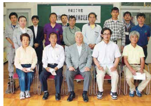
授与式に出席した認定農業者と関係者

6月1日、認定農業者制度に係る三宅村農業改善計画認定証書授与式が行われました。櫻田村長から「地域農業のスペシャリストとして活躍し、作成した計画を目標に農業経営をすすめることを心から期待したい」と激励の言葉が贈られ、認定農業者の方へ証書が手渡されました。 今回、新規認定7人、再認定7人が認定され、継続1人と併せて三宅村の認定農業者数は15人となりました。 問い合わせは観光産業課農林水産係 ☎09992。