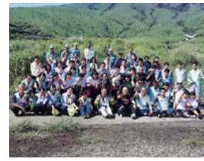
園芸高校の生徒ら

6月6日、みやけ保育園の運動会が三宅村コミュニティセンターで開催され、家族や地域の方々が見守りに訪れました。子どもたちは一生懸命練習してきたリズムをお披露目し、保護者はわが子の成長をしっかりとカメラに収めていました。